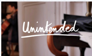
Voir le clip de Unintended (sortie le 29 avril)